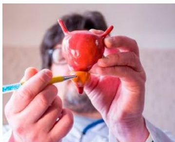
Vergrößerte Prostata: Es muss nicht bösartig sein.

Im Alter zwischen 40 und 60 Jahren entwickeln mehr als 60 Prozent aller Männer Probleme mit Prostata und Blase. Nach dem 50. Lebensjahr ist etwa die Hälfte der Männer von einer Vergrößerung der Prostata betroffen. Anzeichen dafür sind häufiger Harnrang, unvollständige Blasenentleerung, Nachtröpfeln beim Wasserlassen sowie Potenzstörungen. Doch die Beschwerden treten meist erst relativ spät auf. Vorsorgeuntersuchungen beim Urologen ab dem 45. Lebensjahr sollten deshalb eine Selbstverständlichkeit sein. Angst vor einer rektalen Untersuchung müssen die Patienten nicht haben: Sie dauert nur wenige Minuten. Manche Männer empfinden sie als unangenehm, in der Regel ist sie jedoch nicht schmerzhaft. So kann der Arzt beispielsweise feststellen, ob die Prostata