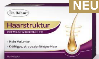
Dr. Böhm® Haarstruktur 30 Tabletten (PZN 6028146)