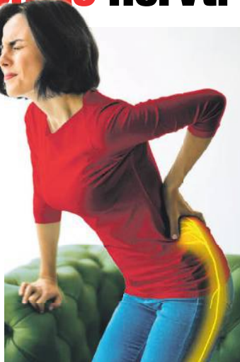
Abbildung Betroffenen nachempfunden

Langes Sitzen, falsches Bücken – und schon ist er da! Ein stechender Schmerz im unteren Rücken, der über den Po bis zum Fuß ausstrahlen kann. Auch Taubheits- oder Kribbelgefühle können auftreten. Hinter den Schmerzen rund ums Gesäß steckt meist eine Reizung oder Quetschung des Ischias-Nervs. Doch Schmerzpatienten können aufatmen. Das Arzneimittel Restaxil Tropfen (Apotheke,