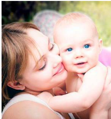
Stillen stärkt die Mutter-Kind-Beziehung.

Stillen ist essenziell Die Weltgesundheitsorganisation (WHO) empfiehlt, Babys in den ersten sechs Monaten ausschließlich zu stillen und sie anschließend bis zum zweiten Lebensjahr begleitend zur Beikost weiter zu stillen. In Österreich werden etwa 90 Prozent der Neugeborenen gestillt, je-