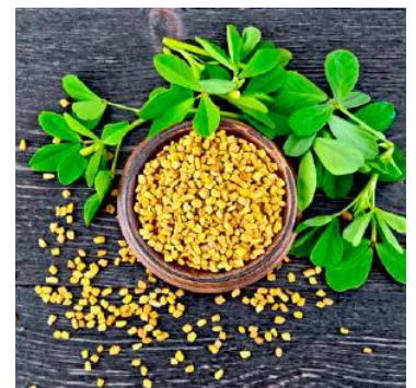
Vor allem die Samen werden verwendet.

Der Bockshornklee ist im Mittelmeerraum beheimatet, seine Verbreitung reicht vom arabischen Raum bis nach Indien. Überall wird er dort schon seit dem Altertum als Heilpflanze eingesetzt – etwa gegen Haarausfall, Hauterkrankungen oder als Aphrodisiakum. Als appetitanregendes Mittel und zur Behandlung kleinerer Hautentzündungen ist der Bockshornklee in der EU auch als traditionelles pflanzliches Arzneimittel zugelassen.