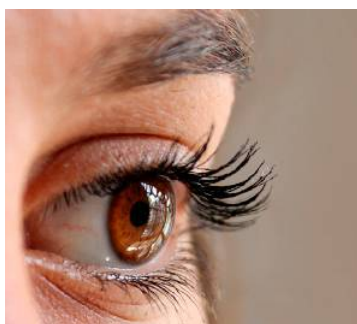
Trockene und gereizte Augen: Das muss nicht sein.

Durch die intensive Nutzung von Bildschirmen reduziert sich die natürliche Blinzelfrequenz um bis zu 50 Prozent. Das bedeutet, dass die Augen seltener befeuchtet werden. In trockenen oder klimatisierten Räumen verstärkt sich dieser Effekt zusätzlich. Die Folge sind brennende, trockene Augen, verschwommenes Sehen und ein unangenehmes Fremdkörpergefühl.