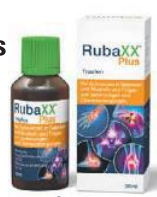
Abbildung Betroffenen nachempfunden

RUBAXX PLUS Tropfen, Wirkstoffe: Rhus toxicodendron Dil. D6, Phytolacca americana Dil. D4, Homöopathische Arzneispezialität bei Schmerzen in Gelenken und Muskeln und Folgen von Verletzungen und Überanstrengungen. Enthält 50 Vol.-% Alkohol. • Über Wirkung und mögliche unerwünschte Wirkungen informieren Gebrauchsinformation, Arzt oder Apotheker.