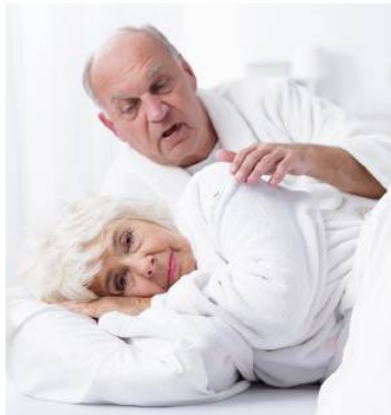
Nächtlicher Blasendrang kann belastend sein.