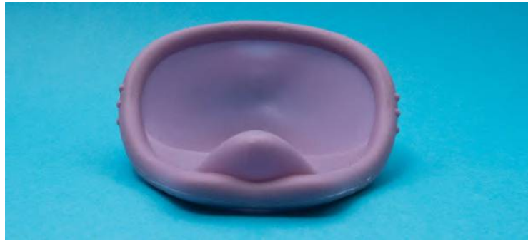
Für die zuverlässige Verhütung mit einem Diaphragma ist die zusätzliche Verwendung eines Spermizids erforderlich.