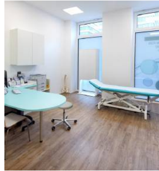
Das ZFM liegt direkt am Hauptbahnhof Wien

Der WOMAC-Score (Maß für Schmerz und Funktion) verbessert sich klinisch hochsignifikant – und das bei minimalem Risiko. „Die Datenlage ist beein-