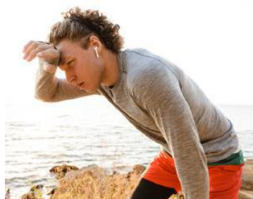
Regeneration ist im Sommer besonders wichtig.

Schwitzen ist eine oft lästige Begleiterscheinung der sommerlichen Temperaturen. Vorrangig ist es jedoch gesund und trägt zur Regulation des Wärmehaushalts bei. Dass man mit Schwitzen den Körper entgiften kann, ist aber ein Mythos. Was tatsächlich herausgeschwitzt wird, ist fast 99 % Wasser sowie Elektrolyte, Spurenelemente und Salze. Diese Stoffe erfüllen im Körper unterschiedlichste Funktionen. Sie dienen als Baustoff für unsere Knochen, beeinflussen die Muskel- sowie Nervenfunktion, regeln den Wasserhaushalt und sind Bestandteil von Hormonen. Beim Schwitzen gehen vor allem Natrium und Chlorid verloren, aber auch Kalium, Calcium und Magnesium werden in geringeren Mengen ausgeschieden. Dieser Verlust ist im Normalfall nicht besorgniserregend. Allerdings können Personen bei extremen Belastungen wie einem